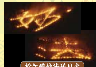
松ヶ崎妙法送り火