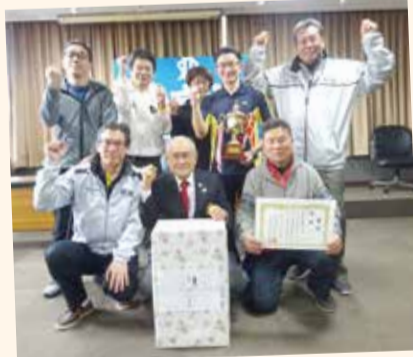
【明德体育振興会チームの皆さん】