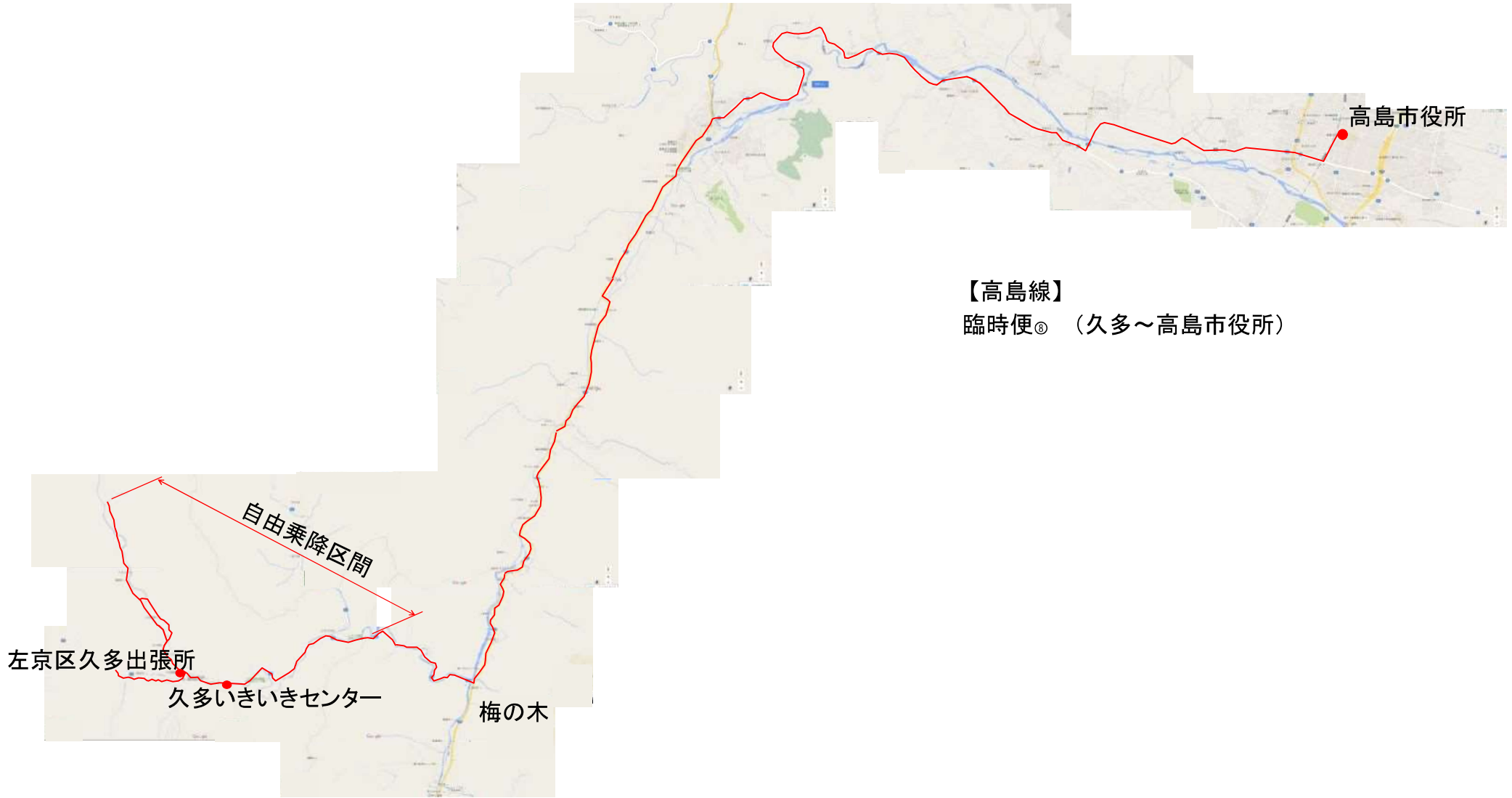
【高島線】 臨時便 ㊟ （久多～高島市役所）