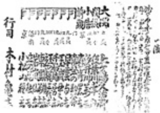
古文書の生きるまちづくり (大原古文書研究会)