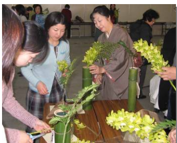
左京区民正月いけ花教室