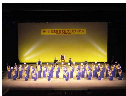
左京区民文化フェスティバル