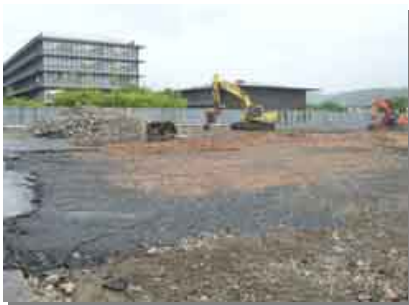
新庁舎建設予定地