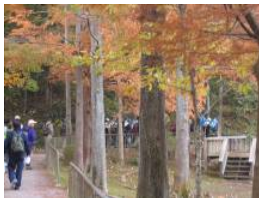
左京区民ふれあいウォーキング