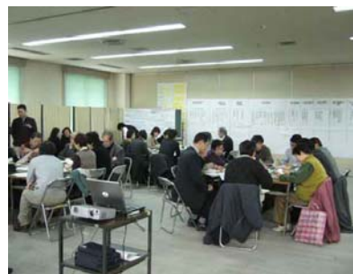
第4回市民参加ワークショップ(19年1月)