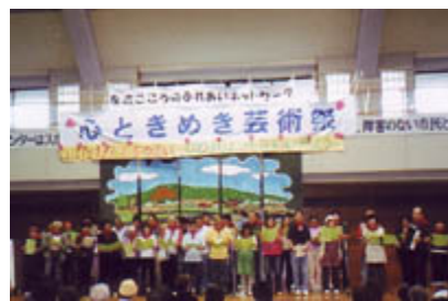
平成18年度 心ときめき芸術祭