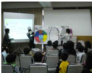
防災教育 (KIDS (京大防災教育の会))