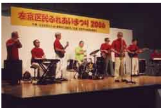
左京区民ふれあいまつり