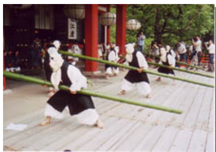
鞍馬山竹伐り会式

平成18年度に作成した左京区内の主な伝統行事・芸能の映像記録（DVD）を活用し、ホームページ等を通じて情報発信の充実に努め、観光振興を図ります。