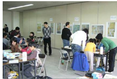
左京区に望まれる新しい区庁舎のイメージ (京都工芸繊維大学大学院工芸科学研究科造形科学域)