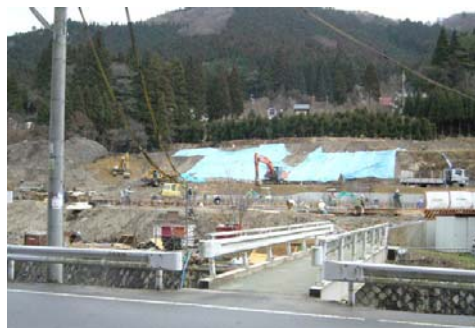
「花友はなせ」(仮称)整備工事(18年12月)