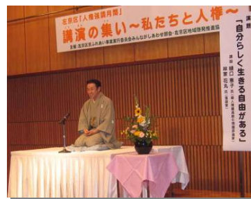
平成18年度 人権強調月間 講演の集い「～私たちと人権～」