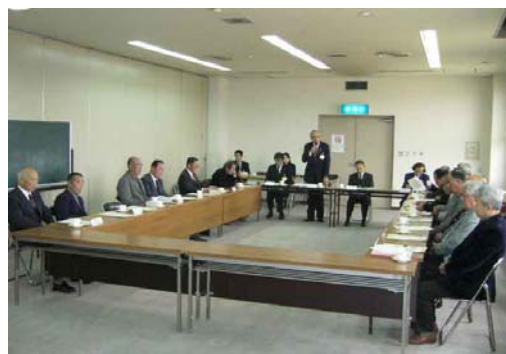
左京区内の伝統行事の保存会等のネットワーク会議