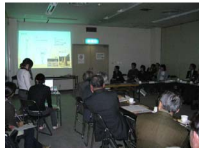
山の保全を考える～伝統行事からの考察～ (広河原松上げ保存会)