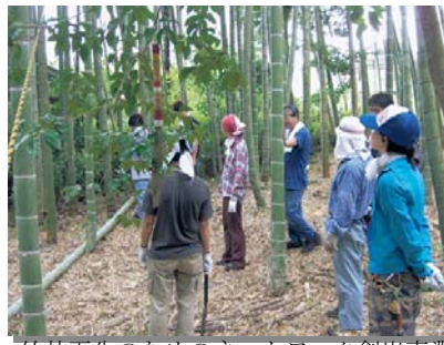
竹林再生のためのネットワーク創出事業 (京都精華大学 竹屋プロジェクト実行会議)