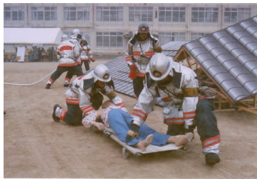
平成 18 年度 左京区防災訓練

大規模な災害の発生を想定し、地域住民と防災関係機関が初期対応訓練や応急対策等訓練をはじめとする訓練を実施します。