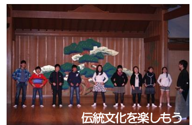
伝統文化を楽しもう

区内小学生等による狂言の鑑賞会を京都観世会館で開催し、伝統文化に親しむ機会を創出します。