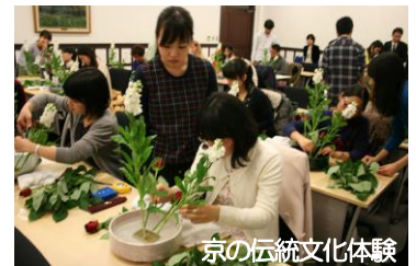
京の伝統文化体験

「大学のまち・左京」に全国各地・世界各国から集まった学生や留学生に対し、左京の伝統文化を体験してもらう機会を創出し、左京の魅力を世界に発信していただく取組として、区内の大学への出前いけばな教室を実施します。