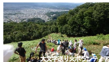
大文字送り火ボランティア

ボランティアしたい学生とボランティアが欲しい地域とを結びつけ、学生のアイデアや行動力を地域のまちづくり活動に活かす。