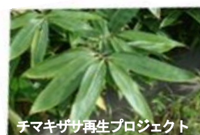
チマキザサ再生プロジェクト

チマキザサの持続的な再生を図るため、これまでから取り組んでいる生育環境の整備や啓発活動に加え、生産から販売に至るまでの流通モデルの確立に向けた現状調査等を実施する。