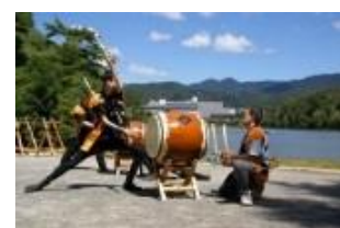
29年度交付団体による活動の様子

30年度は、「重点分野部門」の「伝統文化振興」分野に「明治150年」関連事業を追加（29年度実績 申請：39件、交付：26件）