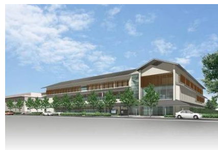
新左京区総合庁舎外観（イメージ）