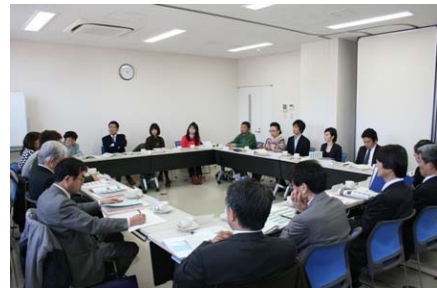
次代の左京まちづくり会議

新左京区基本計画の素案について広く区民の皆様からの御意見を募集するため、パブリック・コメントの実施、シンポジウムの開催に取り組みます。