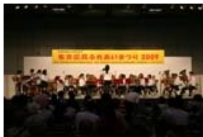
左京区民ふれあいまつり