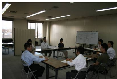
プロジェクトチームの様子