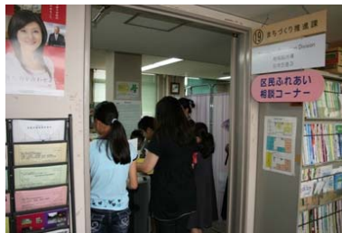
左京区役所を見たい知りたいツアー

左京区役所の窓口業務や「さあ きょうからはじめよう キャンペーン」の取組などについて、区民の皆様にもっと知っていただくため、「左京区役所を見たい知りたいツアー」として、区役所見学を実施します。