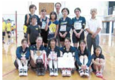
市原野体振チームの皆さん

左京スポーツニュース 【8月27日】 第53回京都市バレーボール祭 各区から4チームずつ出場し、市原野体振チームが2勝して優秀チームとなりました。 【9月3日】 平成29年度京都市チャンピオン大会(女子バレー) 左京区予選会 優勝・市原野体振チーム 準優勝・修学院体振チーム