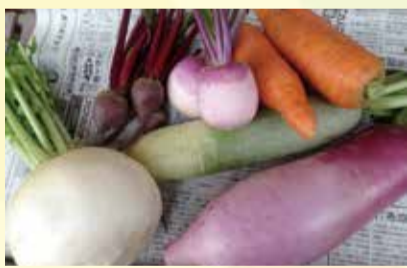
里の駅 大原で売られている新鮮野菜

野菜のメッカ大原へ 夏が過ぎ、稲穂が黄金色に実る頃、稲刈りが行われま す。今では機械で行うため、一日で稲刈りが終わり、翌日には畑になっているという電光石火の早業です。 二毛作のため、田んぼに畝を作り、聖護院大根、青首大根、聖護院蕪、上賀茂の農家であれば、すぐさま菜などの冬野菜の種まきが始まります。 三週間ほどすると、琴線のごとく若葉が芽吹き列を為します。間引いた菜葉をみそ汁やサラダに入れて、口に含むと、暑かった夏が過ぎ、秋が訪れたことを実感します。 今では、聖護院地区や田中地区、鹿ヶ谷地区は都市化が進み、畑が少なくなりました 「里の駅 大原」の直売所も設立され、月曜日以外の毎日朝9時から営業されています。 朝収穫された元気な野菜が所狭しと並べられており、特に土曜・日曜には、野菜を求め、長蛇のお客さんの列が続