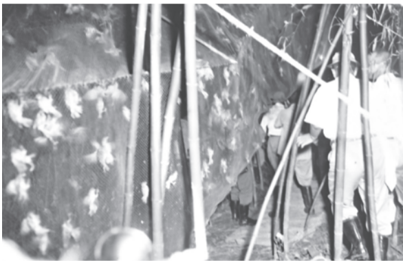
害鳥としてのスズメ狩り。(昭和34年8月31日。宇治。財世界人権問題研究センター所蔵「符川寛氏撮影写真」)

昭和20年代中頃、アトリは1羽5円、ツグミは30円で売れ、メシロやウグイスは、生かした