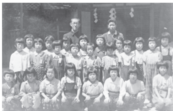
分散授業を受けていた4年生女子。鷲森神社か。(昭和20年。修学院小学校所蔵)

その勉強場所を確保しなければなりません。当時、修学院国民学校は各学年6クラスほどある大きな学校でしたから、その全児童を一カ所で収容できる場所を見つけることはできませんでした。そのため、児童が机やイスを運び出し、上高野地区