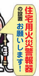
住宅用火災警報器の設置をお願いします!

ほかに設置して良かったという多くの事例が報告されています。まだ設置していないお宅がありましたら、直ぐに設置してください。 問合せ 左京消防署消防係 (☎723-0119)