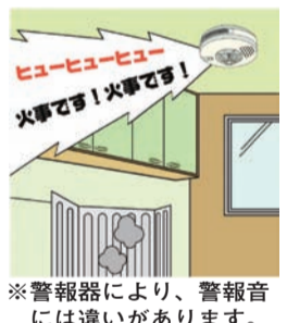
※警報器により、警報音には違いがあります。

場所 左京東部いきいき市民活動センター(市バス「東天王町」下車徒歩2分) 申込み 随時受付で、定員になり次第終了。電話で当センター(☎761-1385)へ ※開館時間は10:00~21:00。日曜日は17:00まで。休館日は毎週火曜日。