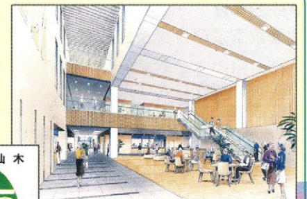
「みやこ杉木」を使った区民ロビー