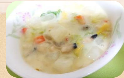
写真は、あさりのむき身を使用

(あさりの下処理) 殻付きのあさを流水で洗う。ボールに塩水とあさりを入れ、冷暗所に1晩おく(3~5時間)。あさは、流水で洗い使う。 ① 大根、白菜、人参をお好みの大きさに切る。 例) 大根・人参→1.5cm角のサイコロ 白菜→1cm幅(葉と芯を分けておく) ② 鍋にバターを溶かし、切った大根、人参、白菜の芯の部分を炒め、少ししんなりしたら、白菜の葉の部分と下処理したあさを殻ごとそのまま入れる。 ③ 2の鍋に薄力粉をまぶし入れながら、全体をよく混ぜたら、豆乳を加えてとろみをつける。 ④ 白味噌を加えて、おろした生姜を加えて出来上がり。 ※) 少し薄く感じたら、塩を少々