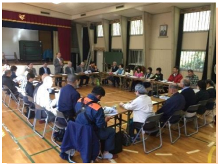
別所・花背・広河原 11/6

今期の地域ケア会議では、西日本豪雨や台風21号の際に、地域の関係機関や介護サービス事業所がどのように対応したのか情報を共有し、今後の連携について意見交換を行いました。地域からは、避難所の開設状況や要配慮者の安否確認・避難誘導等について取組みが報告されました。介護事業所からは、「地域の高齢者宅を訪問して安否確認を行った」「停電被害があった地域の高齢者に入浴サービスを提供した」「サロンを開催して交流の場を持った」等の報告がありました。