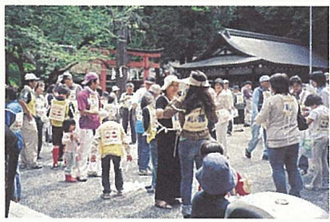
昨年の活動の様子

「吉田山を美しくする会」は、年に2回(6月の第2日曜日と11月の第3日曜日)、吉田山とその周辺地域