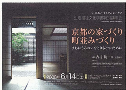
公開講座のポスター