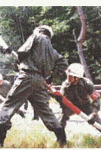
火パトロールを実施します。 教育・訓練

消防団は、市内の各区に設けられていて、現在約4400名余りの団員がいます。消防団員は、普段は自分の職業を持ちながら、火災や大地震などの災害時に参集して、皆さんの「いのちと暮らし」を守る特別職の地方公務員です。