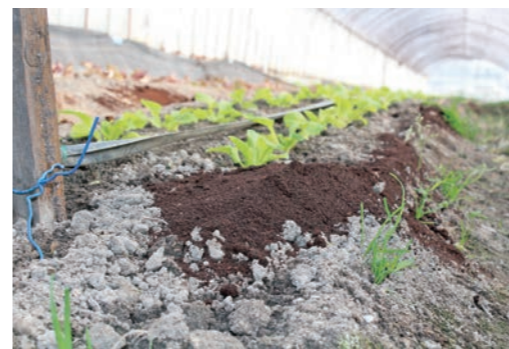
コーヒー豆かすが丁寧にまかれている