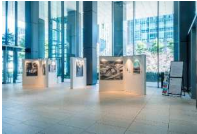
東京スクエアガーデンアートギャラリー