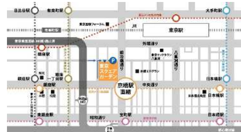
会場までの周辺地図