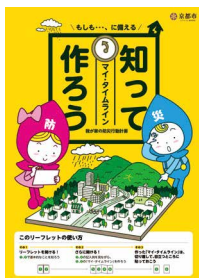
西京区では、地震・水害・土砂災害（一部地域）のハザードマップがあります。