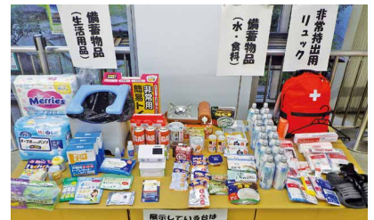
区役所西庁舎1階ロビーで展示しています