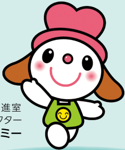
障害保健福祉推進室 マスコットキャラクター エミー

「ユニバーサルデザイン」と聞いても 「なかなかぴんとこない…」という方は 多いのではないのでしょうか？ 「ユニバーサルデザイン」について、 一緒に考えてみましょう！