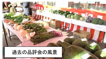
過去の品評会の風景