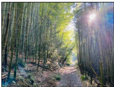
東海自然歩道 コース内