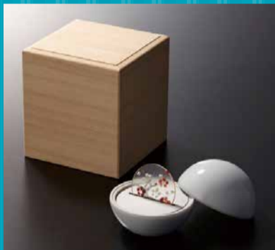
シリカモノリスに清水焼の絵付け技法を施したアロマ器具