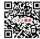
フォト散歩ホームページ

※ いずれか1箇所以上のパネルと撮影いただければ結構です。 ※ 送付いただいた写真については、後日、市民しんぶん・ネット等での公開に同意されたものとさせていただきます。