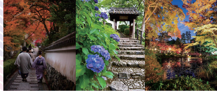
左 昨年の最優秀賞(善峯寺) 「gou0108」様 撮影 中 昨年の優秀賞(善峯寺) 「nobu_4649」様 撮影 右 昨年の優秀賞(大原野神社) 「aroe0326_photo」様 撮影

インスタグラムURL: https://www.instagram.com/oharano_photo/