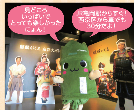
▲明智光秀のパネルと写真が撮れて ご満悦のたけによん!

亀岡にもゆかりのある明智光秀が主演の大河ドラマ「麒麟がくる」。その世界観を味わえるのが「麒麟がくる 京都大河ドラマ館」です。