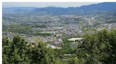
唐櫃越コース(桂坂野鳥遊園北側)から見る西京区の眺め

檜原、中山、塚原、沓掛を経て、老ノ坂に続く道で、国道9号線とほぼ同じルートとなっており、現在でも重要な道路です。