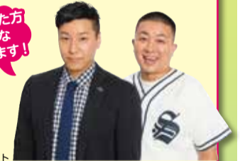
チョコレートプラネット よしもとクリエイティブ・エージェンシー所属

時…日時、時期 所…場所 対…対象 内…内容 定…定員 費…費用 要…必要な物 申…申込み 問…問合せ 休…休日 !…注意 区保…区役所保健福祉センター 区保別…区役所保健福祉センター別館 支保…支所保健福祉センター