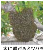
木に群がるミツバチ

ミツバチは春と秋に、女王バチの世代交代に当たって巣分かれをします。数千から数万のミツバチが、新たな巣を作る場所を求めて引っ越しをします。群れに何もしなければ、ミツバチが人を襲うことはなく、数時間から数日で別の場所に移動します。区保健センター衛生課(☎392-5690)