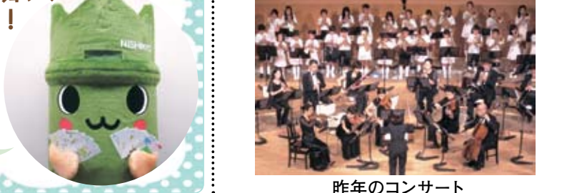
昨年のコンサート

8月23日(土)午後2時～3時30分(受付1時30分～) 所 西文化会館ウエスティ 先着448名 無料 当日、直接会場へ