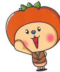
小林 匠さん ※総選挙 1 3 位