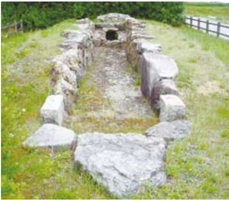
下西代2号墳の復元

西京区とその周辺地域の古墳・遺跡を巡るウォーキングを開催します。今回は小規模な群集墳が点在する大原野を歩きます。平安京が成立する以前の西京区の様子について、楽しく学んでみませんか。