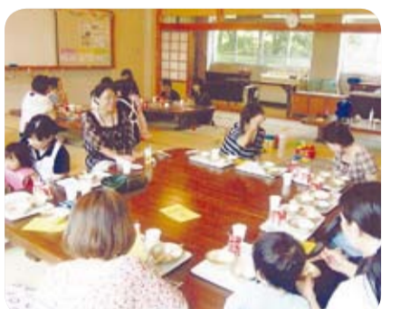
子育てサロン事業

「民生児童委員とは?」 民生委員は、厚生労働大臣からの委嘱を受け、非常勤の地方公務員として、ボランティアで活動しています。