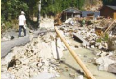
台風12号による被害