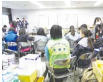
仙台市若林区役所でのミーティング

本市においては、東日本大震災の発生直後から、職員の派遣や支援物資の搬送などを行ってまいりました。西京区役所・洛西支所からは22名の職員を被災地へ派遣しました。