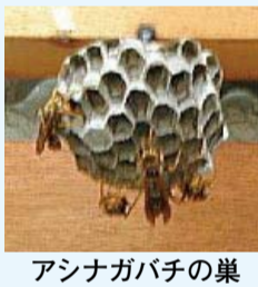
アシナガバチの巣