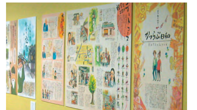
昨年度の「西京魅力探訪」

支所 平成24年1月16日(月)～1月24日(火) いずれも1階ロビーで、午前8時30分から午後5時まで。 問合せ 区役所まちづくり推進課(☎381・7197) 支所まちづくり推進課(☎332・9318)