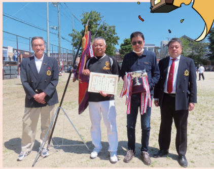
壮年の部優勝チーム(朱二学区)