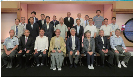
※写真撮影時のみマスクを外しています。