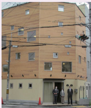
完成した建物外観