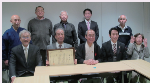
完成を喜ぶ市長と朱雀第一学区の皆さん ※撮影時のみマスクを外しています。

昨年着工の朱雀第一学区の自治会館の建て替え工事が、令和3年12月末に完了しました。消防分団詰所のほか、新たに学童クラブが併設されるなど、子どもからお年寄りまで多くの方が利用する地域の拠点として生まれ変わりました。