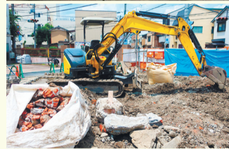
着工前と現在の工事の様子