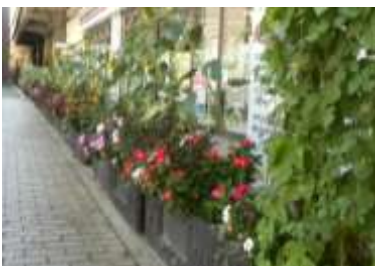
二条駅前の花植え

また、中京警察署では、学区ごとの犯罪マップを毎月発行しており、地域で活用されています。