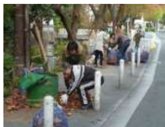
高瀬川の一斉清掃