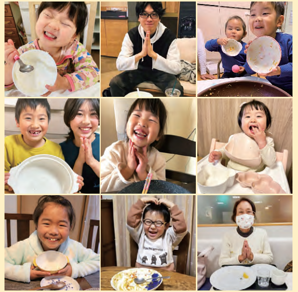
◀食べきりフォトコンテスト(2020年) 応募作品