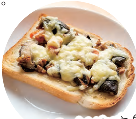
麻婆茄子がピザに変身!

例えば、炒め物は、パンに乗せてチーズをかければピザに変身! 思わぬところから美味しい創作料理が生まれるかもしれません。