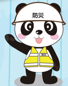
南区広報キャラクター「ナンナン」