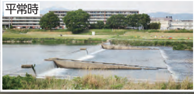
久世橋上流側の桂川 (平成30年7月豪雨)