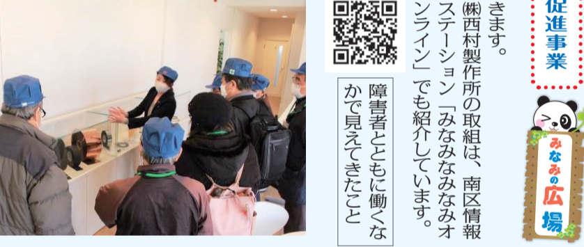
動切断取組機等の設計・製作・販売・メンテナンスを行う(関西村製作所)の取組は、南区情報ステーション「みなみなみみみオンライン」でも紹介しています。

第26回 南区企業の「知」活用促進事業 12月27日(月)、スリッター(自)の備えの大切さ、そしてそれを区民の方々に伝えることの重要性を学んでいただきました。 最後に生徒からは「区役所の役割や防災啓発の大切さを学んだ。今後キャリアに活かしていきたい。」といった感想をいただきました。 参加者からは「NSスリッター」の看板をよく目にするが、どんな仕事をしているのかわからなかった。「こんなに素晴らしい会社が南区にあることを誇りに思う。」などの声をいただきました。有意義な見学会となりました。 南区では今後も、区内の企業と区民との交流促進に取り組んでい