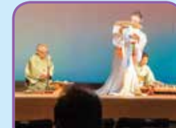
邦楽の分野で活躍する芸術家による文化発表会を開催