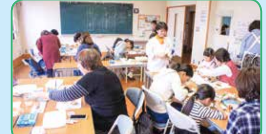
高齢者と子どもたちが一緒にクッキーにメッセージや絵を描く体験を実施