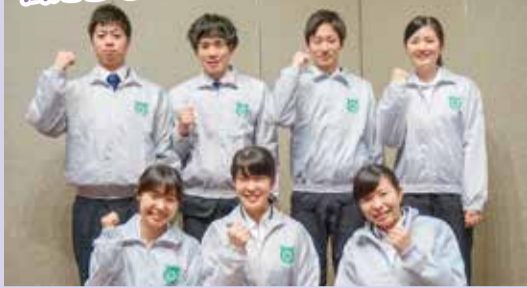
平成29年度南区役所配属の新規採用職員7名