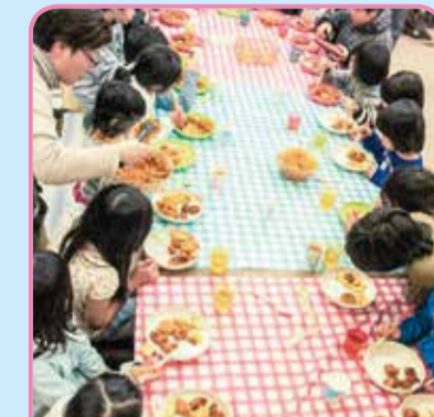
家庭事情で孤食に悩む子どもたちに食事場所の提供と学習支援を実施

平成28年度、南区役所が採択した一般枠9事業では、文化芸術、福祉・健康など、幅広い分野でまちづくり活動が進められました。