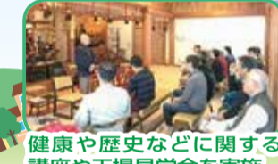
健康や歴史などに関する講座や工場見学会を実施