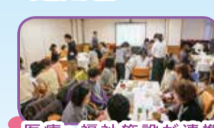
医療・福祉施設が連携して、無料送迎やセミナーを実施