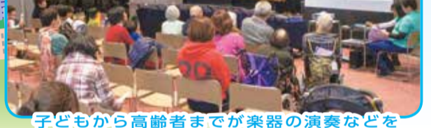
子どもから高齢者までが楽器の演奏などを体験できるコンサートを開催