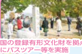
国の登録有形文化財を拠点にバスツアー等を実施