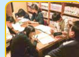
不登校又は不登校傾向にある子どもたちを対象に学習を支援