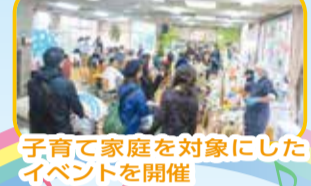
子育て家庭を対象にしたイベントを開催