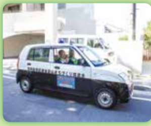
青色防犯パトロール