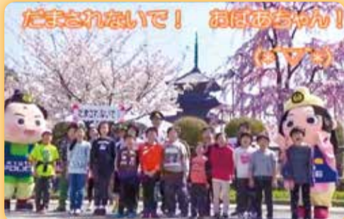
特殊詐欺被害防止啓発