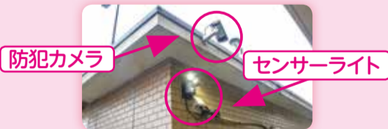
防犯カメラやセンサーライトの設置

区内の犯罪認知件数は平成22年に2,433件であり、以降年々減少し、平成28年には1,316件となりました。