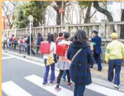
通学路防犯パトロール・見守り