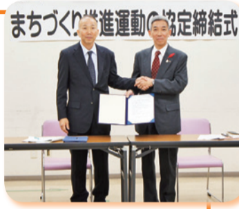
まちづくり推進運動の協定締結式

2 南区役所と南警察署が、区民との協働で一層の安心安全を実現するため、「世界に誇る歴史と文化を守る南区の安全で安心なまちづくり推進運動」協定を締結！