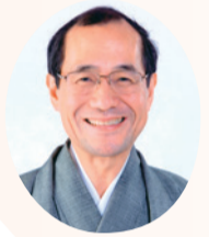
京都市長 門川 大作

4 ①の協定に基づく南区の取組を進めるため、「世界一安心安全・おもてなしのまち京都 市民ぐるみ推進運動」南区推進会議設立準備部会を設置！（9月、11月、12月に会議を開催）