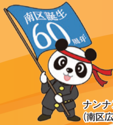
ナンナン (南区広報キャラクター)

ホームページアドレス http://www.city.kyoto.lg.jp/minami/