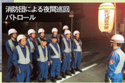
消防団による夜間巡回パトロール

中でも、今年、創立60周年を迎えた南消防団では、区民の安心・安全を守るため、日夜、活動に取り組み、毎年12月には、南消防署と共に、巡回広報活動や夜間巡回パトロールで、年末の出火防止を呼び掛けます。