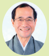
京都市長 門川 大作