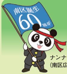
ナンナン (南区広報キャラクター)

ホームページアドレス http://www.city.kyoto.lg.jp/minami/