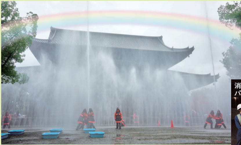
南区民ふれあいまつりでの南消防団による記念放水訓練(東寺 金堂前)

南区では地域力(みなみか)を原動力に、区民、各種団体、企業の皆さんや関係行政機関などが連携して、災害に強いまちづくりを進めています。