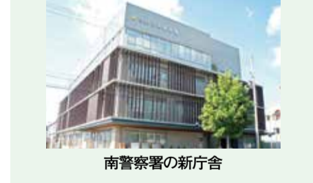
南警察署の新庁舎

南警察署は昭和32年築の全国で最も古い庁舎から、府市連携により、市・生活環境美化センター(十条大通大宮東入る南側)の敷地の一部に、地上5階建て、延べ床面積約5千平方メートルの新たな機能・設備を充実させた庁舎として新築移転しました。 新庁舎は今後も、南区民の一人の安全安心を確保する新たな拠点として運用されます。 ☎=南警察署(☎682-0110)