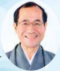
京都市長 門川 大作