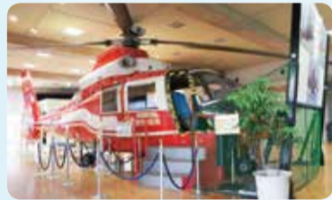
市民防災センター(西九条菅田町)