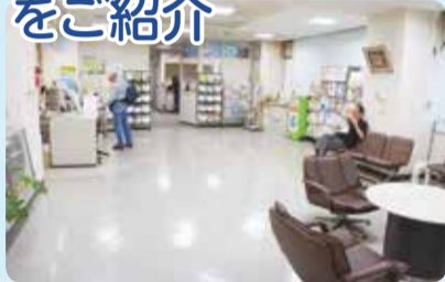
南区役所1階ロビー