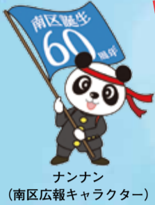
ナンナン (南区広報キャラクター)

ホームページアドレス http://www.city.kyoto.lg.jp/minami/