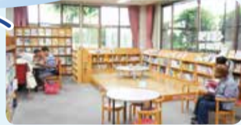
図書館 (南図書館、吉祥院図書館、久世ふれあいセンター図書館)