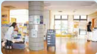
いきいき市民活動センター (吉祥院、上鳥羽北部、上鳥羽南部、久世)