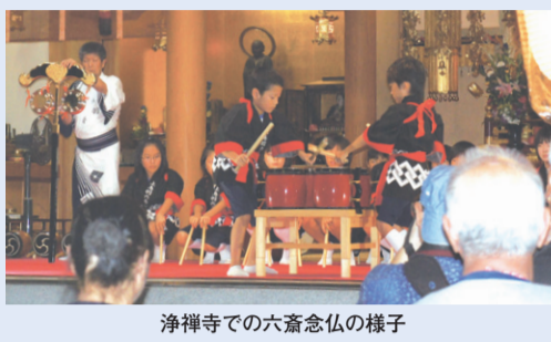
浄禅寺での六斎念仏の様子

8月22日(京)の六地藏めぐりの1か所に数えられる浄禅寺(上鳥羽)で、六斎念仏の奉納が行われました。