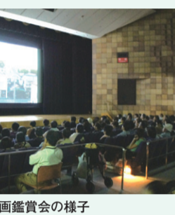
人権映画鑑賞会の様子

東寺の協力を得て、毎年夏休みに開催しているもので、11月9日に開催予定の「南区民ふれあいまつり」で、会場内での展示と優秀作品の表彰式を行います。