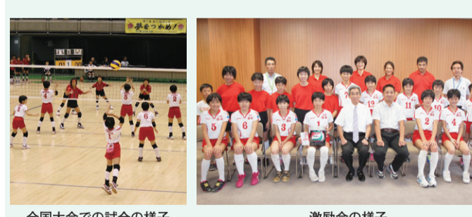
全国大会での試合の様子

学ぶとともに、ソーラーカーキットを組み立て、実際に光を当てて走らせたときには歓声が上がりました。