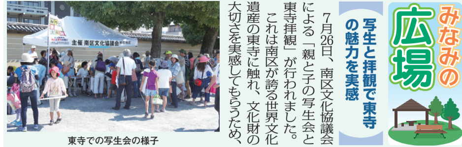
東寺での写生会の様子