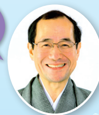
京都市長 門川 大作