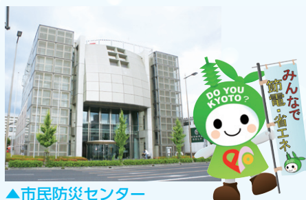
▲市民防災センター

このほか、ヘルスピア21、図書館、児童館、保育所(園)、いきいき市民活動センターなどがあります。