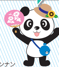
ナンナン(南区広報キャラクター)