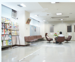
▲南区役所1階ロビー