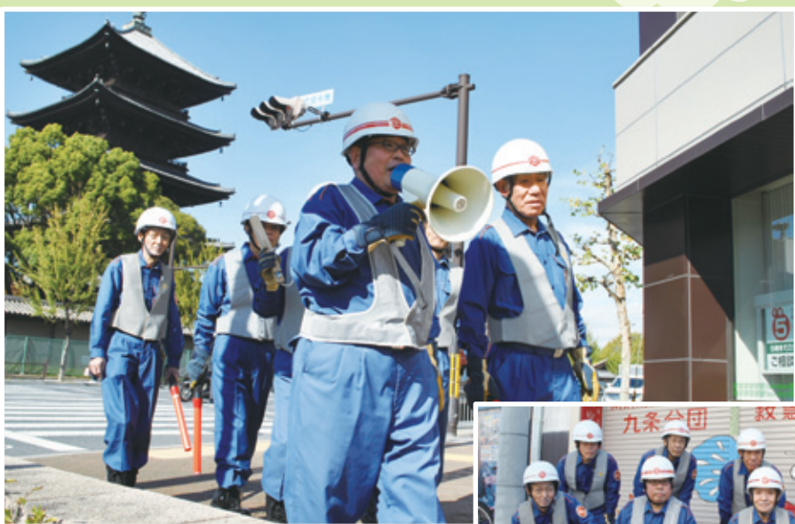
消防団による火災予防の広報活動