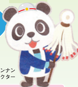
ナンナン 南区広報キャラクター

年の瀬を控えた何かと慌ただしい師走。この時季は空気が乾燥し、暖房器具の使用も増えるため、火災が発生しやすくなります。