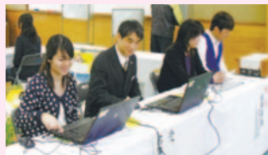
投票事務に従事している南区選挙サポーター

◎南区選挙管理委員会事務局(地域力推進室内) ☎681-3439、FAX681-5513