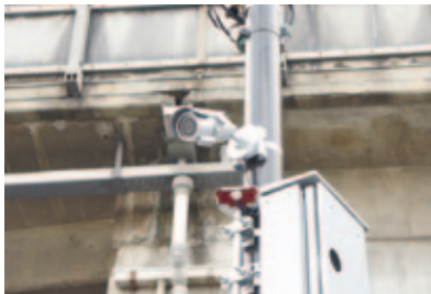
設置された防犯カメラ

このほど、「JR西大路駅周辺に防犯カメラ3台が設置されました。これは唐橋学区自治連合